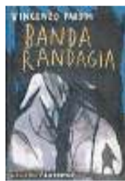
BANDA RANDAGIA di Vincenzo Pardini Fandango Libri Pagg. 210 Euro 15